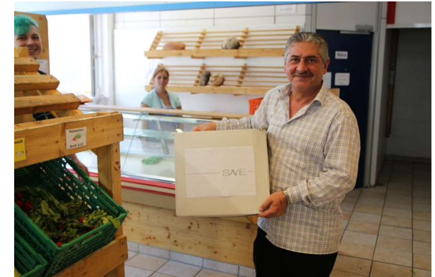
SAVE SOCIETY bei der Schwäbischen Tafel

Die SAVE SOCIETY konnte bereits die ersten Hilfsaktionen erfolgreich umsetzen, wie zum Beispiel, das Verteilen von SAVE SOCIETY Care-Paketen, die Verteilung von Kleidung an Hilfsbedürftige, Lesungen in Altenheimen, um nur einige zu nennen.